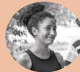
Raquel Soza Comunicação