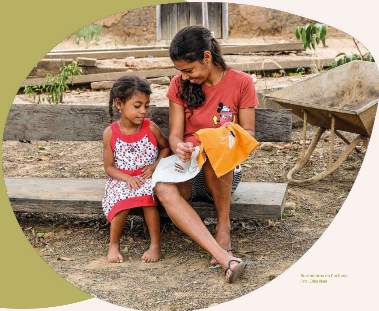
Bordadeiras do Curtume

A TINGUI ACREDITA NO IMENSO POTENCIAL DA CULTURA E DOSSABERES DAS COMUNIDADES RURAIS E QUILOMBOLAS